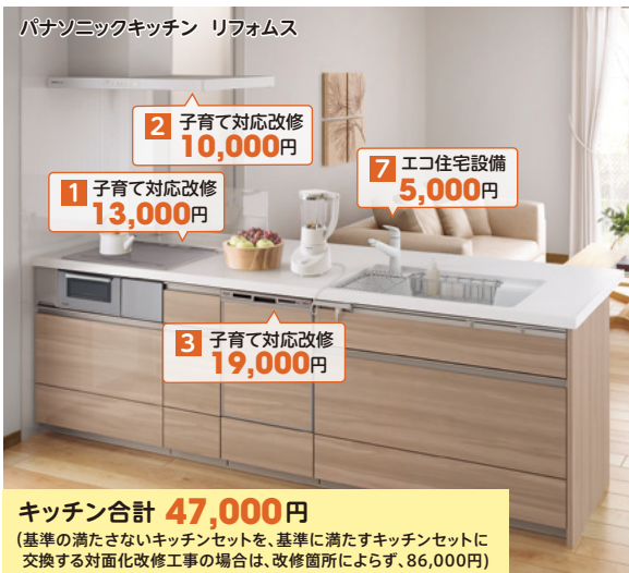
パナソニックキッチン リフォーム