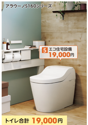
アラウーノS160シリーズ