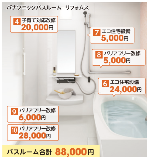
パナソニックバスルーム リフォーム