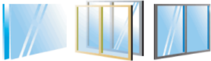
ガラス交換 内窓の設置 外窓の交換