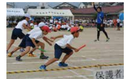
↑（一番手前がイッキ）

私も負けずと綱引きで、サッカーのコーチ達と一所懸命頑張りました。その様子がこれだ3・2・1