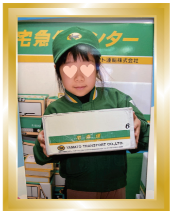
—今回のハッスちょっと— キッザニア甲子園の職業体験です。 花の宅急便(´_`)コロナ前写真