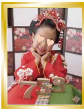
〜今回のベストショット〜 野見神社へ七五三参り

耐震改修含む大型リノベーション工事が昨年完了いたしました。各部屋にたくさんのキャットウォークを付けてまして、いつでもどこでも歩けるようにしたんですが、引っ越しをしてすぐだったせいか、なかなか上がってくれないようです。困みに、この写真はお施主様が抱っこしてキャットウォークに乗せた写真です。(°_°) 超可愛い〜(°o°) 次号でこのリフォームの特集をします。