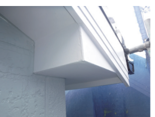
防水下地後の仕上げ写真→