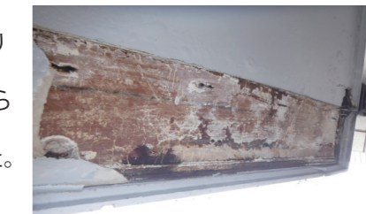
↑結果、下の階の天井材や、梁材が腐り始めていました。もう少し発見が遅ければ、ベランダそのものが落ちることも考えられます。