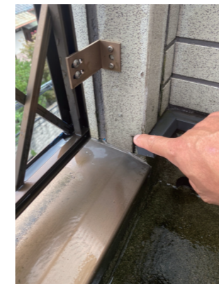
←ベランダの飾り格子部分のわずかな穴から大量の雨水が入っていました。