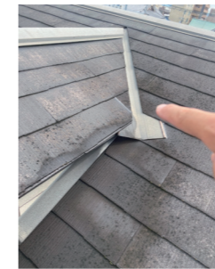
↑雨漏れ発覚箇所が3箇所ありました。