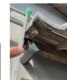
↑入り組んだ底の穴からの雨漏れ