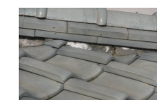
↑屋根漆喰からの雨漏れ

多くの施工業者が、数年先の予防策を考えて下地施工をしていない為、10年たてば、腐っている場合もあります。皆さま注意して家を観察してみてください。ご不安を解決するために、何かあれば当社までご連絡くださいませ。住まいのことならすべてお答えできますのでご安心ください。相談、見積もり、無料です。