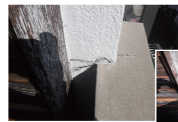
↑ベランダ手摺壁ひび割れ