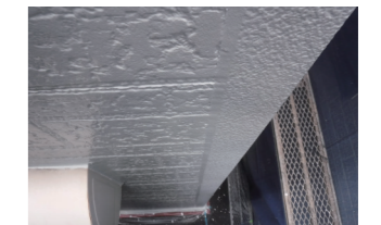
↑新しく目地の取替工事を行い、足場を組んだついでに全面塗装を行いました。